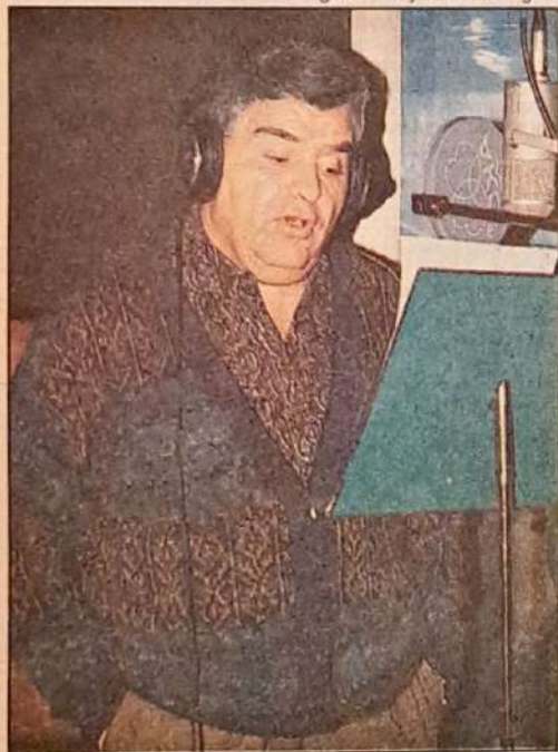
Luego de estar toda la tarde grabando "Sábado Gigante", Mario Kreutzberger puso su voz -en Filmocentro- como solista del himno que muy luego todos escucharemos a través de las radios y la TV.